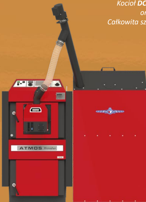
Zestawienie kompaktowe Kocioł DC 18 PSX z kompletem AZPU 400 C Podajnik DRA25 – 1,7 m i zasobnik 400 l Całkowita szerokość zestawu 1390 mm