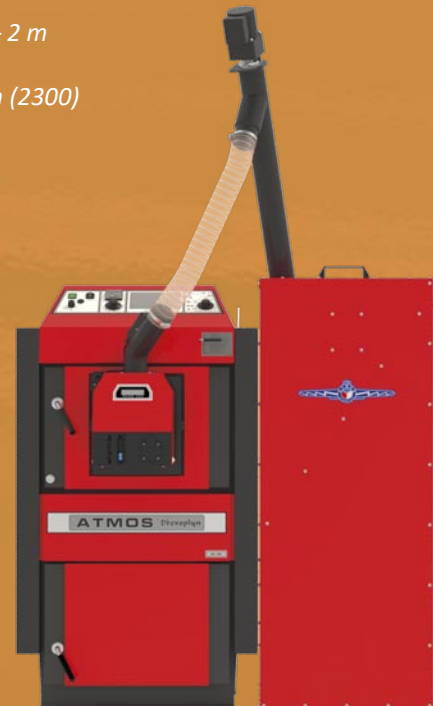
Zestawienie kompaktowe Kocioł DC 18 PSX z kompletem AZPU 240 C Podajnik DRA25 – 1,7 m i zasobnik 240 l Całkowita szerokość zestawu 1175 mm